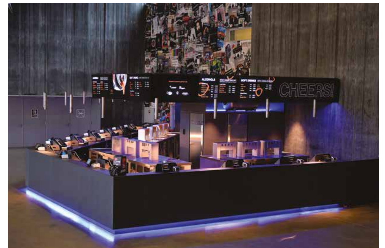
Nouvelle implantation du bar de la Rockhal

de sinistre, tel un incendie, la proposition de réaliser un Disaster Recovery Site a été discutée en 2019. Suite à la finalisation des études en décembre 2019, les travaux débuteront dans le courant de l'année 2020.