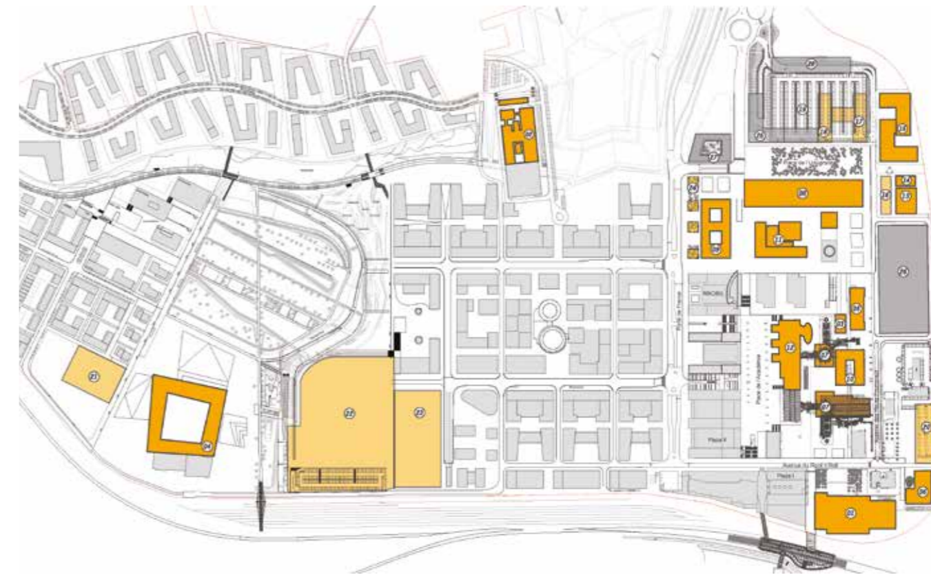
Plan d'implantation des bâtiments

Parallèlement à la construction de bâtiments, le Fonds Belval a continué à intégrer dans ce nouveau tissu urbain des éléments naturels, dont des forêts urbaines dans la partie Nord-Ouest de la Terrasse des Hauts Fourneaux. Ces forêts contribuent à